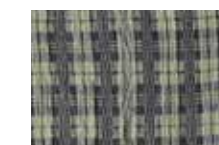
ブラウン × イエロー

monk's belt シングル size: 約 40×190cm price: ¥ 11,000(税込) monk's belt ダブル size: 約 80×190cm price: ¥ 16,500(税込)