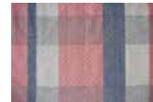
ピンク × ネイビー

material: コットン80% ウール20% ※シングル・ダブルとハーフは柄の出方が異なります。