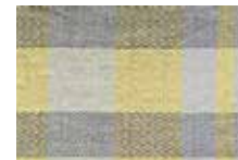
イエロー × グレー