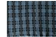
ブラック × ブルー