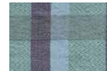
ブルー × グリーン