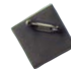
台座はアンティーク ゴールド加工